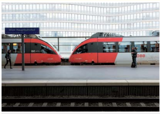
【訂正】前号「心のスナップ」記事で、「1泊2日」は誤りでした。「2泊3日」に訂正します。

4月の中旬から5月の初めにかけて、チュリッヒ・ヴェニス・ブタペスト・ウィーンへ鉄道を利用した旅をしました。そのときに見かけたウィーンの駅の風景です。日本と違って改札口はなく、ただ切符を買って目的の列車に乗り込むだけ。列車の中で車掌が検札にきます。国を越えれば、その国の車掌が乗り込んできて、またしっかりと検札していきます。海外で鉄道を利用する旅は初めて。楽しかったです。