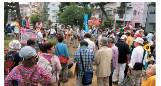
7/9 国民平和行進、御影での集会