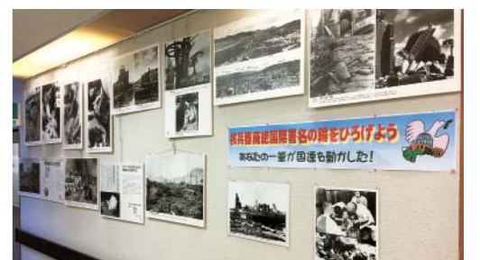
東神戸病院で原爆パネル展開催中