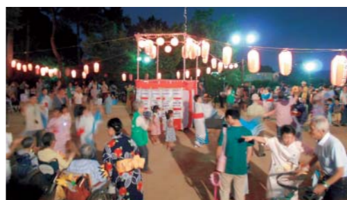
8/5 東神戸病院など盆踊り大会