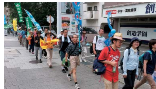
7/9 国民平和行進、芦屋から御影へ