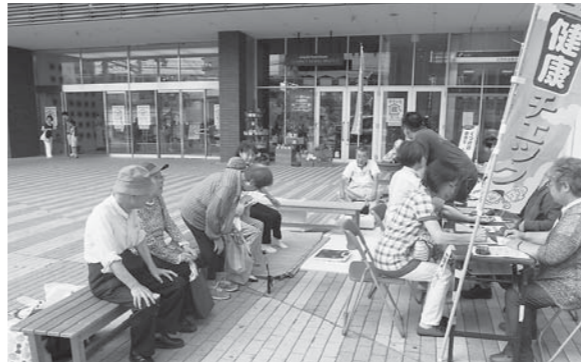
青空健康チェック

めっちゃ暑い夏も一息、東... 6月の総代会決定で「一人... 互助組合員さんとの架け橋... 支部のうちの支部で青空健康... チェックや組合員訪問行動を... おこない、数々の経験を... ことができました。