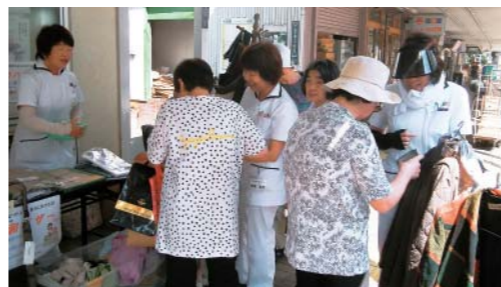
7/20 生田診療所で平和バザー