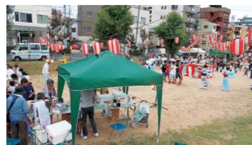
7/22 東診・柳診が平和盆踊り大会