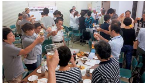
7/25 原水禁世界大会社行会